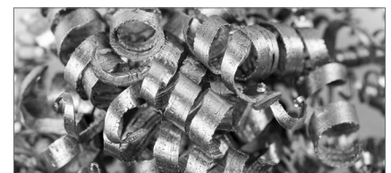
INŻYNIERIA 1. STOPNIA

Czy wiesz, że oferujemy usługi inżynierskie pierwszego etapu, aby przyspieszyć Twoje procesy?